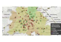
Schulen Abi-Ergebnisse der Oberschulen ab sofort online einsehbar